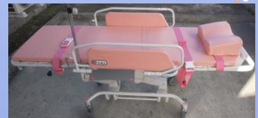
ストレッチャー (背上げ機能付き)