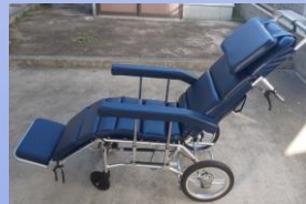
フル リクライニ ング式 車椅子