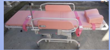
ストレッチャー (背上げ機能付き)