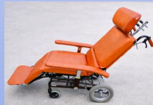
チルト機能付 フル リクライニング式 車椅子