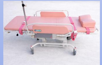
ストレッチャー (背上げ機能付き)