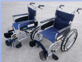
スタンダードタイプ車椅子 (自走式・介助式)