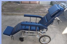
フル リクライニ ング式 車椅子