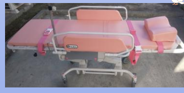
ストレッチャー (背上げ機能付き)